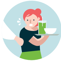
آزار و اذیت جنسی