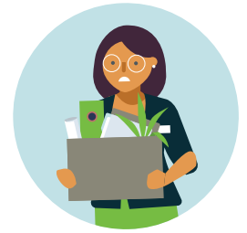
اخراج غیر منصفانه