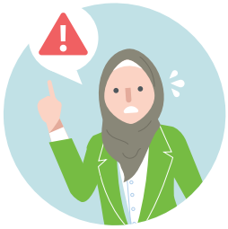
جنجالای حقوق کاری

مو محکمه بیطرف رابطای جای کار د استرالیا استه. مو کارگرا و صائب کارا ره کمک مونی که مشکلائی کاری ره حل کنن. ای شامل موشه د: